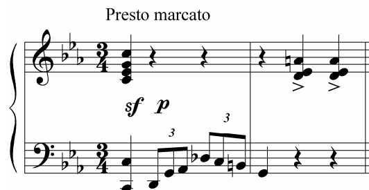
Ej.2: Gutiérrez, Toccata y Fuga , compases 40-41.

La primera sección de esta toccata (A) termina con un acorde de séptima medio disminuida. Este acorde se convirtió en un elemento clave en la música de algunos compositores románticos como Chopin, Wagner o Tchaikovsky, quienes lo usaron en momentos de particular intensidad dramática. En la obra de Gutiérrez este acorde sirve como transición hacia la segunda parte la Toccata (B). Esta nueva sección lleva la indicación Presto marcato y temáticamente se relaciona con la sección precedente ya que su tema (Ej. 2), se origina en un giro melódico presente y desarrollado en la sección A (Ej. 3).