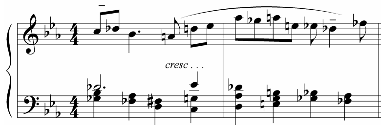
Ej. 3: Gutiérrez, Toccata y Fuga , compases 8-9.

Esta sección, caracterizada por el movimiento rápido, alternando entre tresillos y corcheas, presenta también una referencia a la Toccata opus 11 de Prokofiev, con el uso de notas repetidas. Aquí, ingeniosamente, Benjamín Gutiérrez combina el elemento percusivo de la toccata del siglo XX con la técnica del desarrollo motivico característico de la toccata del período barroco (Ej. 4).