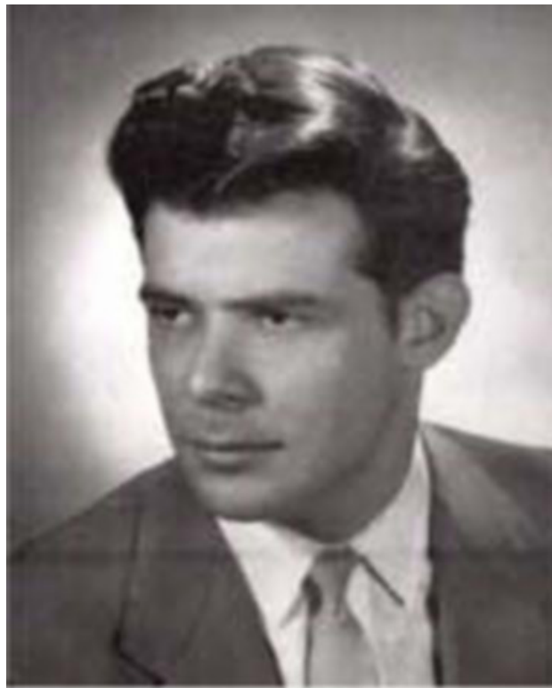
BENJAMIN GUTIÉRREZ SÁENZ (n. 1937)

Su estilo es contemporáneo-romántico, con orquestación firme y armonía disonante sin extremos, en la cual el uso de la tonalidad, dentro de un contexto libre, aparece oscurecida por acordes que hablan idiomas del siglo veinte. 2